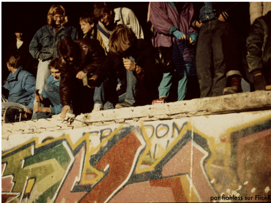
Jeunes sur le mur, Berlin, 10 novembre 1989.

Ce jour là, l'Allemagne est devenue un pays comme les autres. »